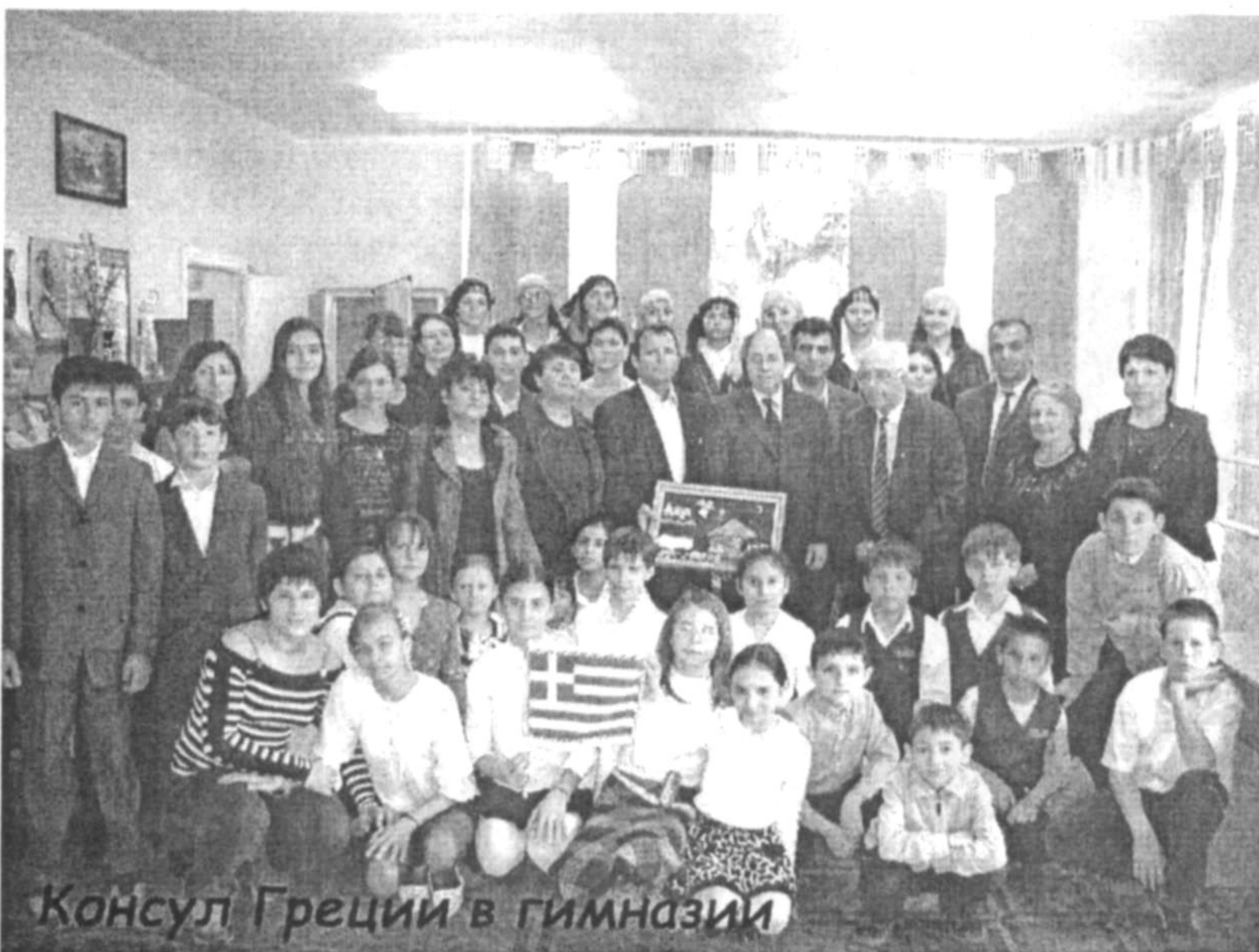
Консул Греции в гимназии